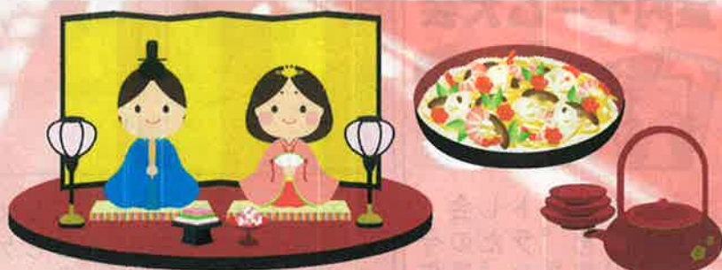
※日程は変更になる場合がありますのでご了承下さい。